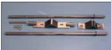
C177 Mástil para farola doble en acero cincado de 80 cm.

El mástil (su conjunto) está compuesto por: 2 tubos de 95 cm. 2 abrazaderas (son las que se fijan a la farola) 2 pernos (sujetan la abrazadera a la farola) 4 pasadores (fijan los tubos a las abrazaderas. También se utilizan para hacer de tope final con el banner).