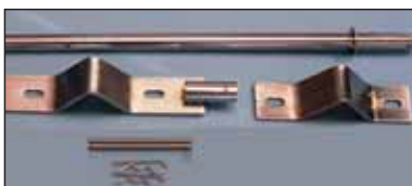
C177/1 Mástil para farola simple en acero cincado de 80 cm.