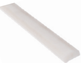
Difusor LPC/4 "Omega" blanco Se sirve por metros