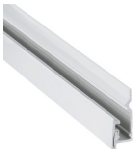
Perfil de aluminio, anodizado LPC plata 2,40 mt.