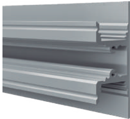
Perfil de aluminio

Ofrecemos una garantía de 2 años en perfiles y difusores.