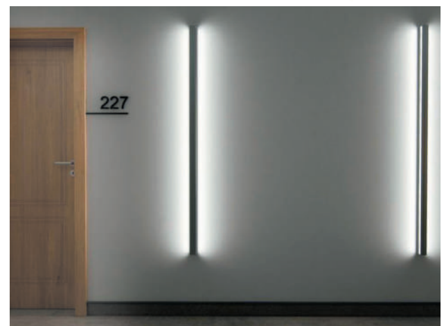
Opción: rodapié de aluminio