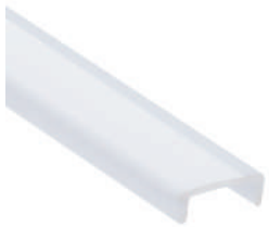
Difusor de policarbonato