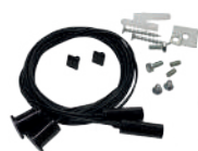
Kit de suspension

18.001 transparent 2m 18.002 opalin 2m 18.003 glacé 2m 18.004 transparent 6m 18.005 opalin 6m 18.006 glacé 6m 18.134 glacé 60m