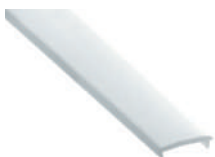
Diffuseur en polycarbonate "easy-ON" (Up)

18.001 transparent 2m 18.002 opalin 2m 18.003 glacé 2m 18.004 transparent 6m 18.005 opalin 6m 18.006 glacé 6m 18.134 glacé 60m