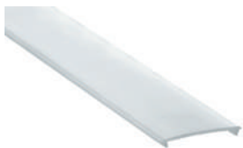
Diffuseur en polycarbonate "easy-ON" (Down)

18.074 glacé 6m 18.075 microprismatique transparent 6m 18.076 microprismatique glacé 6m