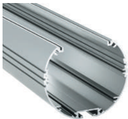
Profil en aluminium