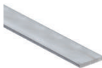
Platine séparatrice 200cm